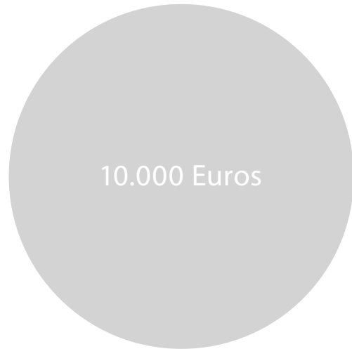
Máximo por cada uno